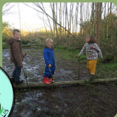
é q u i l i b r e , c o l l a b o r a t i o n