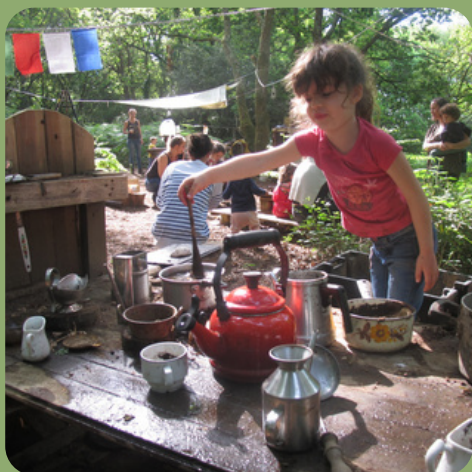
m o t r i c i t é f i n e