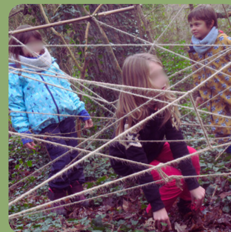
j o u e r