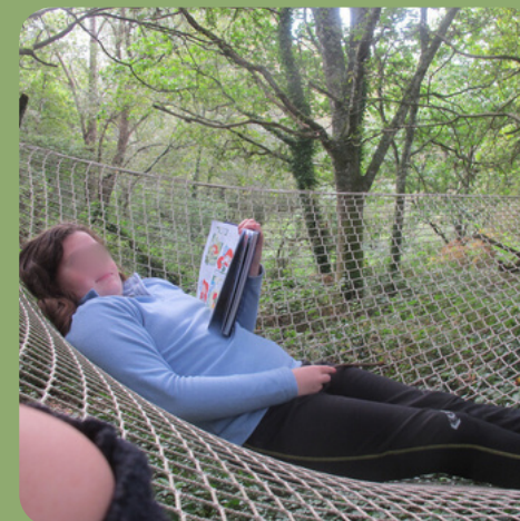
d é t e n t e , b e s o i n d e c a l m e