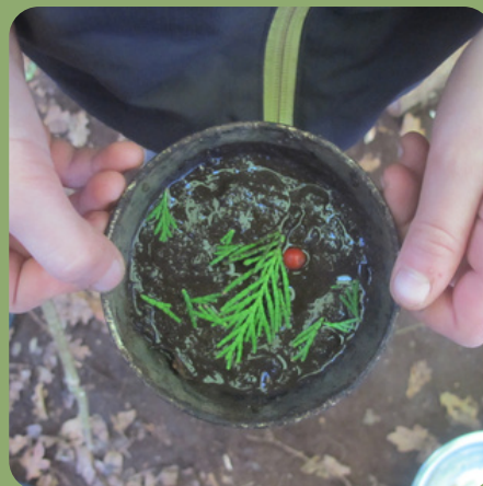
i n v e n t e r , c r é e r