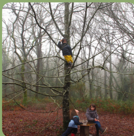
g r i m p e r